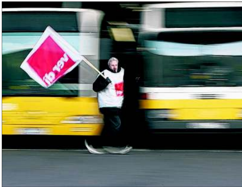
Wegen des Warnstreiks der Fahrer stehen die Räder der gelben Busse und Bahnen am Donnerstag still; wer zur Arbeit muss, sollte sich nach Alternativen umsehen oder zu Fuß gehen

Die Beschäftigten des Klinikums Stuttgart planen um 9 Uhr eine Kundgebung vorm Katharinenhospital. Dazu erwartet Riexinger etwa 500 Teilnehmer; auch Beschäftigte der umliegenden Krankenhäuser seien dazu eingeladen. Allerdings ist mit den Kliniken eine Notdienstvereinbarung abgeschlossen worden, so dass dringende Operationen und Behandlungen stattfinden